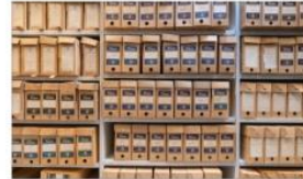
NETERVIS: Et stort, omfattende og ganske komplett arkiv fra De Norske Klippfiskekaperens Landsforening ble etablert i 1931 og til det sammenhengende Unidoc ble avviklet i 2015. En stor del er saltdokumenter og korrespondanse med de mange landene som har importert klippfisk til Norge.