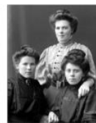
VELLE-ARKIVET: Tre ukjende damer.