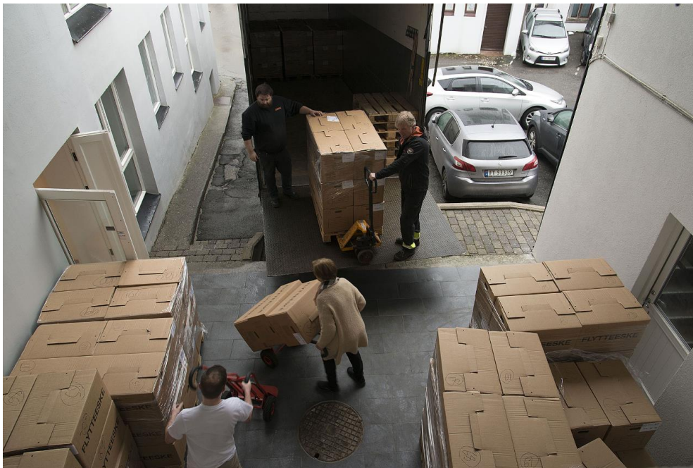
Mottak av 200 kasser med arkiv frå Stranda kommune.

Stor aktivitet ute i eigarkommunane i 2019. Her frå Volda kommune: