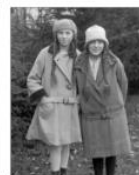
VELLE-ARKIVET: To ukjende jenter.