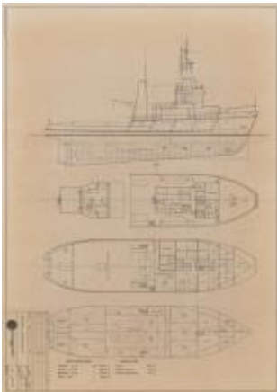
Byggeprosjekt 02575 ved Bolsønes Verft

Prosjekt med å digitalisere skipsteikningar og fartøyhistorie i samarbeid med SEDAK, Næringshistorisk foreining og Stiftelsen Maritim historie i Kristiansund er i gang. Programvaren som er skaffa kan nyttast både på kart, teikningar, notar og foto.