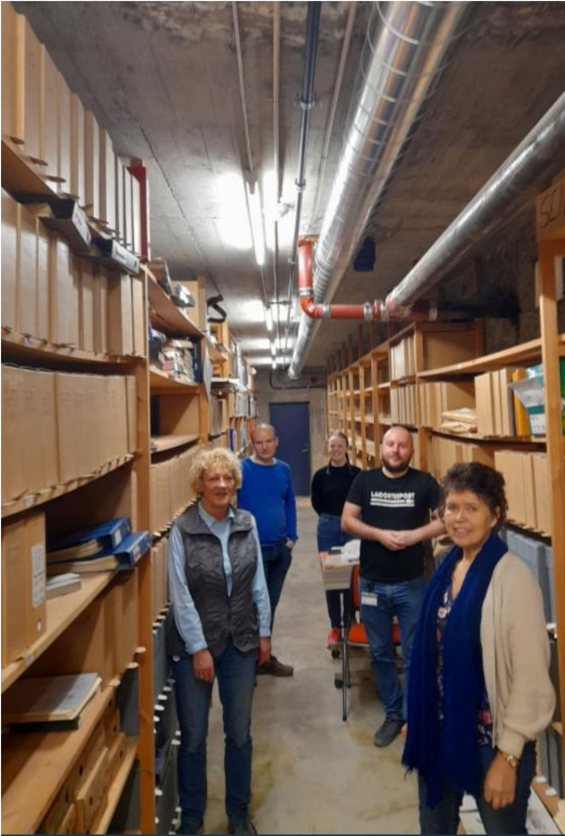
Nedpakking Molde kommune