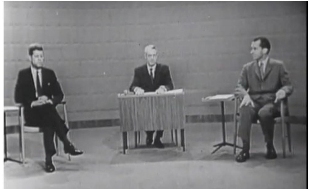
Kennedy - Nixon debat, 1960