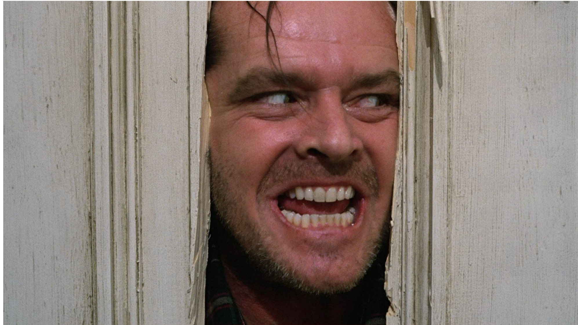
Jack Nicholson, The Shining, 1980