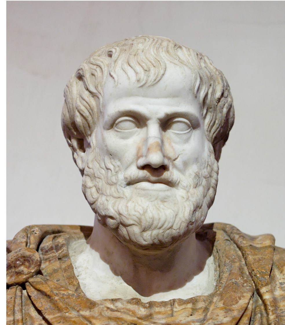
Aristotle (384 - 322 f.kr.)